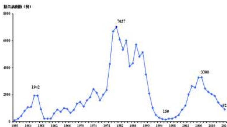
图 1. 1950-2014 年中国狂犬病报告发病数